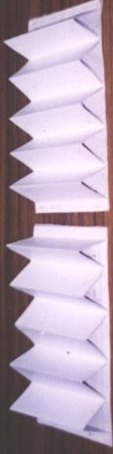
クロネゴキブリの巣 内側に従来品の寒冷紗を張りつけた(左側) 内側に「よもぎくん」を張りつけた (右側)

試験要請：アサヒペン株式会社 試験場所：住友化学株式会社 宝塚中央研究所F棟 供試虫：上記F棟飼育 クロネゴキブリ 試験期間：H12.6.8～H12.7.11 34日間 試験品：ユニチカ防虫ネットよもぎくん 試験内容：クロネゴキブリ忌避効果試験